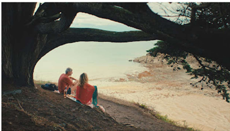
Sur le sentier

https://vimeo.com/1066213072?fl=pl&fe=sh