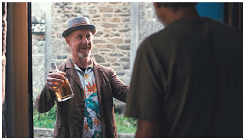
Sur le sentier

Et la fin, que l'on ne dévoilera pas, kitch en diable, entérine cette touche à la fois tendre et légère qui inonde tout le film. Paul est un personnage un peu lunaire qui plutôt de refaire le monde tente d'en cerner quelques contours. S'étant réfugié toute sa vie dans l'astrophysique, il cherche à convaincre Thomas , son ami d'enfance incroyablement moderne de la philosophie quantique. Avec le même, tels deux personnages sortis du Club des Cinq , ils partent en vadrouille avec des ruses de sioux repérer la tanière de la femme inconnue qui s'est installée dans l'île.